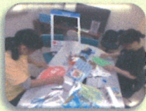
展示物作成中です