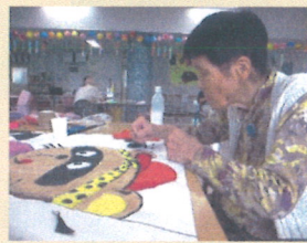
どんなのができる?