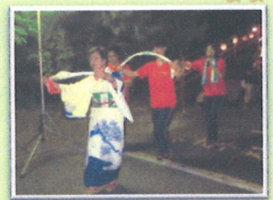
東広島音頭を、利用者さんと家族、職員だけでなく、地域の皆さん子ども達もひとつの輪になって楽しく踊りました。