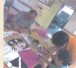
さて、完成は? 7ページをみてね