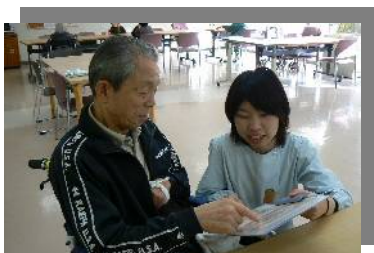
利用者さんお一人お一人にお伺いしています。

御菌寮で暮らす利用者さんにとって、食事は楽しみのひとつです。毎日の食事をさらに楽しんでいただく為に月2回、2種類のメニューから利用者さんに好きなメニューを選んでいただく選択食を行っています。今回のメニューは写真で紹介している「グラタン」と「スパゲッティ」にサラダとスープ・フルーツをつけてのメニューでしたが、この他にも「サンドウィッチとピラフ」や「焼きうどんと天ぷらそば」など、普段なかなか提供できないメニューを選択してもらっています。これからも利用者さんが選ぶことの楽しみや食への関心をもっていただけるようなメニューを考えていきたいと思っています。