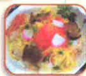
第3位 『五目ちらし寿司』