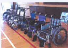
施設で使用している車いす