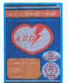
AED 設置提供協力施設

※ 御園寮は、近隣で AED が必要な事態が生じた場合のために「AED 設置提供協力施設」になっています。必要な場合は、すぐにお声かけ下さい。